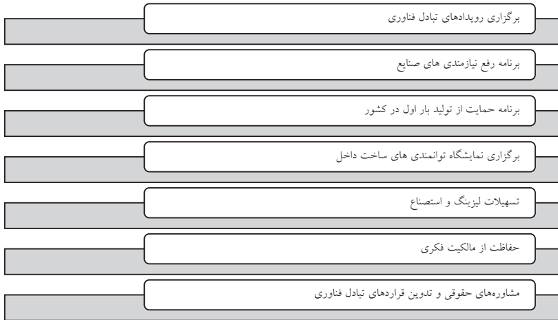
شکل (۱): ابزارهای استفاده شده به منظور افزایش همکاری های شرکت ها

بررسی ابزارهای استفاده شده در ایران نشان می دهد که سیاست جامعی در راستای افزایش همکاری های فناورانه وجود ندارد و هنوز سیاست گذاران این حوزه تمرکزی برای تعریف و به کارگیری ابزارهایی برای توسعه همکاری های فناورانه نداشته اند. ابزارهای استفاده شده تاکنون صرفاً برای ترغیب شرکت ها برای همکاری فناورانه نبوده و یکی از کاربردها آن می تواند همکاری فناورانه باشد. لذا شناسایی ابزارهای مناسب برای نیل به وضعیت مطلوب این نوع از همکاری ها ضروری به نظر می رسد.