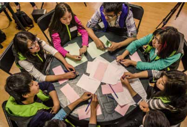
تصویر ۲: گردهم آیی کودکان و تبادل اطلاعات، مأخذ:

http://www.ecpat.org/wp-content/uploads/2016/05/Children_at_table-1024x678.jpg