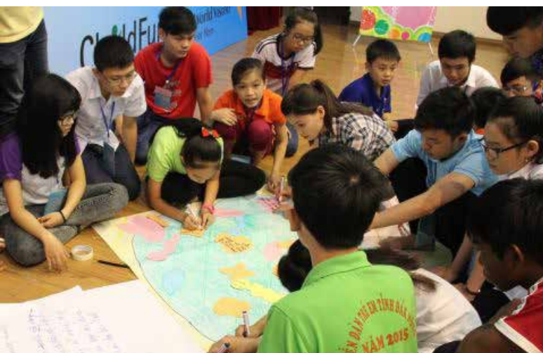
تصویر ۱: گروهی از کودکان و ترسیم جزئیات در نقشه، مأخذ: http://www.wvi.org/sites/default/files/styles/large/public