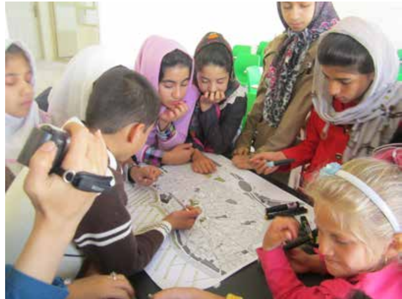
تصویر ۴: شناخت محله و ترسیم جزئیات در نقشه توسط کودکان، محله هرندی، تهران.

طرح شهر دوست‌دار کودک بم شامل پروژه‌های متعددی بود که به لحاظ عملکردی و زیرساختی نیازهای کودکان را تأمین می‌کرد. این پروژه‌ها شامل احداث زمین بازی، ایجاد تجهیزات بهداشتی، تأمین آب نوشیدنی سالم، تجهیز امکانات بهداشتی مدارس، ساخت مدرسه، احداث مرکز نگهداری کودکان خردسال بوده است. در این پروژه‌ها که در فرایند مشارکتی برنامه‌ریزی و طراحی شده است، مانند پروژه مدرسه رویایی؛ طراحان پس دریافت نظر کودکان اولویت‌بندی آنها نسبت به موضوعات و پیشنهادات را با اولویت‌هایی که گروه طراحان در نظر گرفته بودند مقایسه