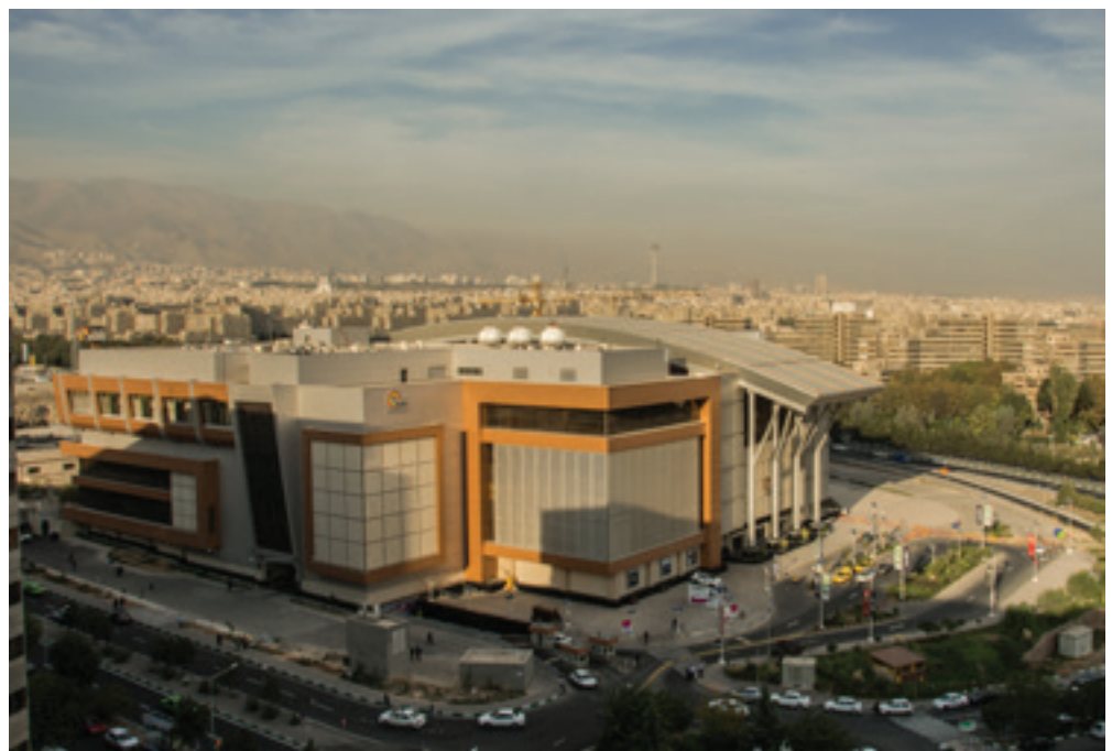
تصویر ۲ Pic2