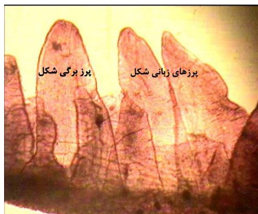
نگاره ۱- پرزه‌های برگ‌ی و زبانی شکل

خمل‌های روده از لحاظ شکل و اندازه به طور قابل توجهی در هر بخش متفاوت هستند (۳۱). طبق تعریف Mouwen در سال ۱۹۷۱ خمل‌ها از نظر شکل به شش دسته زبانی، برگ‌ی، انگشتی، پل مانند، رشته‌ای و پیچیده (نگاره‌های ۱ و ۲) تقسیم می‌شوند (۲۲).