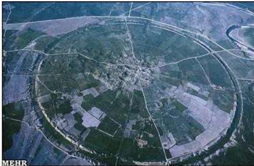
تصویر شماره ۲- شهر اردشیر خوره (مهر آفرین، ۱۳۹۳: ۲۰۱)

چنانکه ملاحظه می‌گردد، قلمرو دایره‌ای شکل شهر با قلمرو سایر شهرهای این دوره مشابهت دارد. ایجاد این نوع قلمرو به ساسانیان کمک می‌کرده است که بتوانند امنیت شهرهای خود را بهتر کنترل نمایند (تصویر-۲).