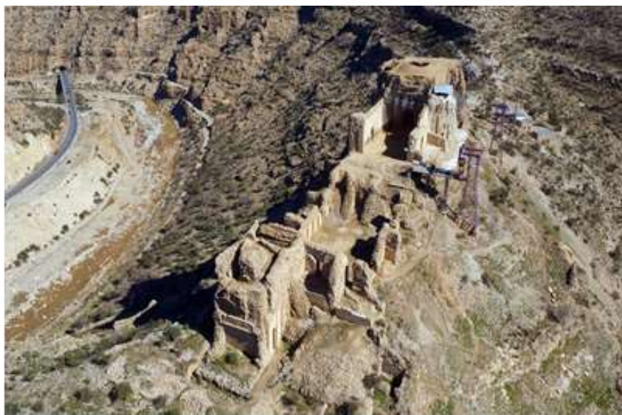
تصویر -۵- قلعه دختر

نیروهای دولت تازه تأسیس را در مقر دژ مستقر می‌کرده و در صورت حضور نیروهای ارتش امپراتوری اشکانی یا هر دشمن دیگر، تا راه را با دفاع عامل برای ورود آنها به دشت ببندند. ارتفاع بالاتر دژ از سطح دره، امتیاز برتری را به نیروهای ساسانی می‌داده و چه‌بسا با نیروهای کمتر نسبت به دشمن می‌توانستند به پیروزی رسیده و مانع ورود دشمن به دشت و شهر اردشیر خوره شوند (تصویر -۵).