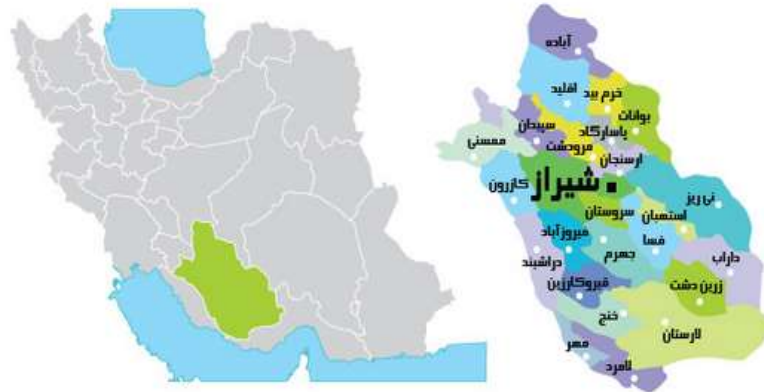
تصویر ۱- موقعیت شهرستان‌های فیروزآباد در استان فارس (صالحی، ۱۳۹۷: ۶۴)

چنانکه ملاحظه می‌گردد، قلمرو دایره‌ای شکل شهر با قلمرو سایر شهرهای این دوره مشابهت دارد. ایجاد این نوع قلمرو به ساسانیان کمک می‌کرده است که بتوانند امنیت شهرهای خود را بهتر کنترل نمایند (تصویر-۲).