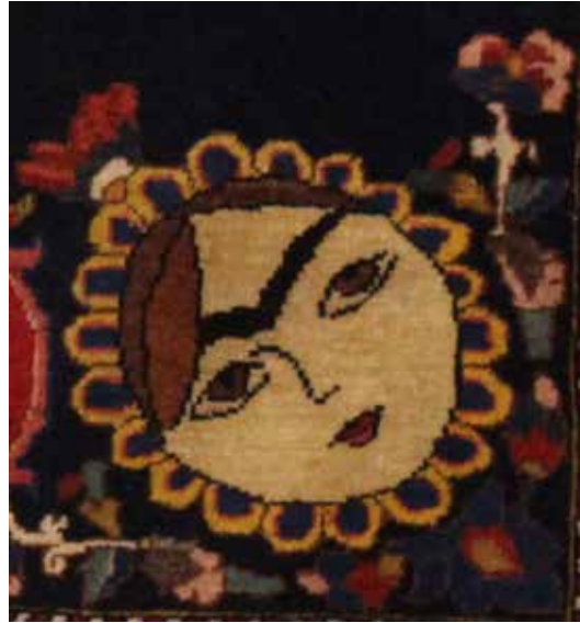
تصویر ۵- حضور نقش مایه خورشید خانم در بخش از متن فرش، بافت اصفهان، ۱۲۷۷ ه. ش، ۴۹×۱۳۶ (مأخذ: نگارندگان)