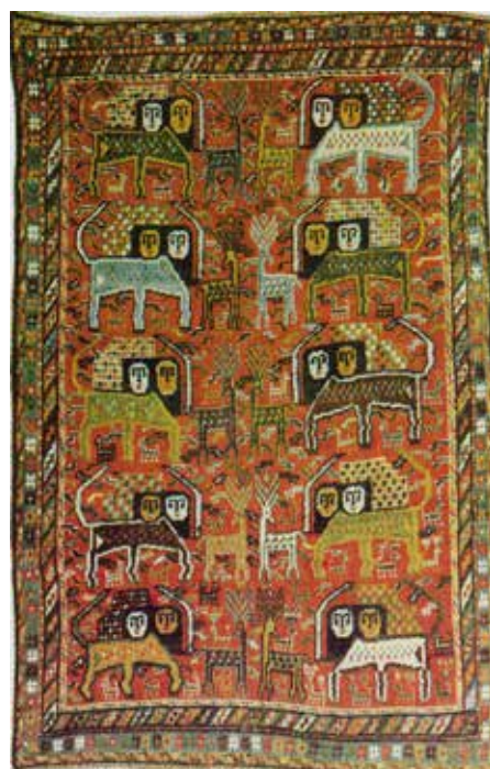
تصویر ۹- قالی منطقه البروج، نقش خورشید خانم بر فراز ایام سال، محل بافت اصفهان، ۱۱۸۰ ه. ش، ۲۱۸ × ۱۴۵

ارائه شده، برمی آید. از این رو کاربرد این نقش در قالی های عشایری امری بدیهی است که در نتیجه ارتباط نزدیک آنان با فصول مختلف سال، رخ داده است و از سوئی دیگر کاربرد آیینی آن نیز مورد توجه است که در پی هویت ملی شکل گرفته و در قالی های بسیاری انعکاس یافته است.