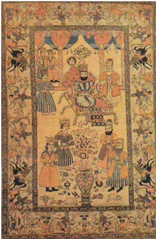
تصویر ۸- قالی تصویری، نقش خورشید خانم بر فراز تخت سلطنت، کاشان، دوره قاجار، ۱۳۰×۲۱۱ (مأخذ: ژوله، ۱۳۹۰: ۱۱۸)