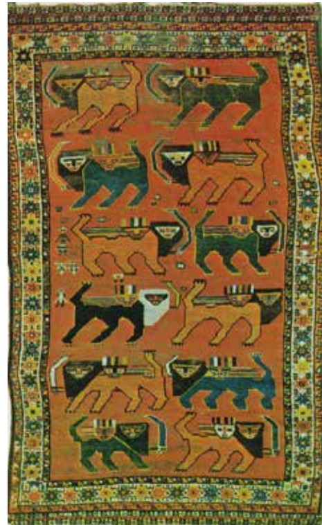
صویر ۱۱- فرش قشقایی، نقش خورشید خانم در پشت شیر، محل بافت فارس، ۲۹۴×۱۲۵

عنصر قالب در این نگاره است در فرهنگ ایرانی به سبب ماهیت گرمابخش و نورانی مورد تقدس و احترام قرار گرفته و یادآور میترا و اهورامزدا پیش از اسلام و ذات احدیت مطلق در عصر اسلامی است. همچنین مادینگی که دیگر عنصر موجود در نگاره مورد بحث است، از دیرباز نمادی از باروری، پاکی و لطافت به شمار می آمده است. از این رو نگاره خورشید خانم به سبب تلفیق دو عنصر خورشید و مادینگی، حامل مفاهیم نمادین دو عنصر مذکور است و به طور کلی بر مفاهیمی چون الوهیت و ذات حق تعالی توأم با لطف و رحمتش دلالت دارد. بدین سبب خورشید خانم، نقش مایه‌ای ویژه در هنر قالی و دارای مفاهیم آیینی و فرهنگی است.