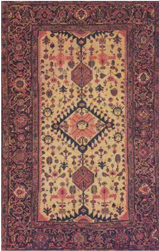
تصویر ۳- نقش خورشید خانم در ترنج فرش، فراهان، ربع پایانی دوره قاجار، ۱۳۷×۲۱۱ (ژوله، ۱۳۹۰، ۳۵۴)

لچک قالی، جایگاه دیگری در قالی ایرانی است که در آن نگاره خورشید خانم فرصتی برای حضور می‌یابد. حضور این نگاره به سبب جایگیری در لچک قالی و نوع طرح در این ناحیه، به شکل پرخونی ناقص با رخساره‌ای کامل