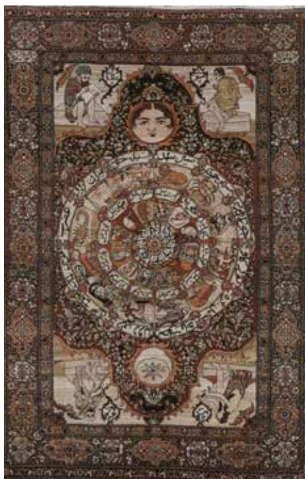
تصویر ۱۰- فرش قشقایی، نقش خورشید خانم و شیر، محل بافت فارس، ۲۴۵ × ۱۶۰ (مأخذ: تناولی ب، ۱۳۵۶: ۱۲۳)