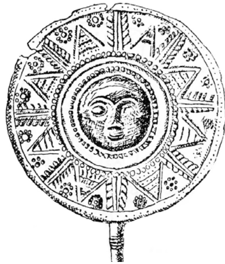
تصویر ۱- سر سنجاق مفرغ لرستان، ۱۲۰۰ - ۱۰۰۰ ق. م،