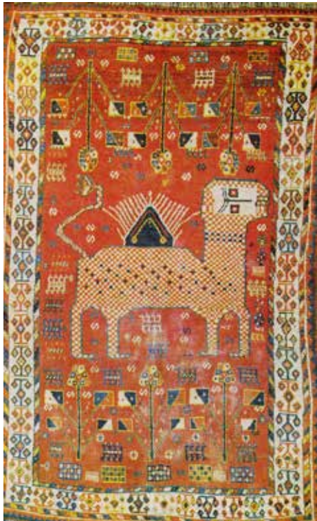
تصویر ۱۲- فرش قشقایی (کشکولی)، نقش شیر و خورشید خانوم، محل بافت فارس، در فرش فارس، ۱۱۵×۱۸۸ (تناولی ب، ۱۳۵۶: ۱۱۴)