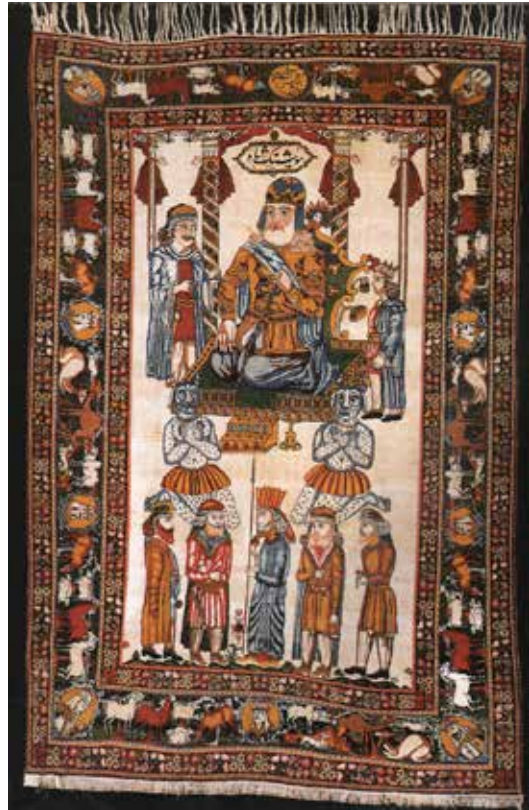
تصویر ۶- فرش هوشنگ شاه، نقش خورشید خانم در پس هوشنگ شاه، کرمان، ۱۲۸۳ ه. ش، ۱۳۵×۲۰۷ (مأخذ: بصام، ۱۳۸۳: ۱۹۲)