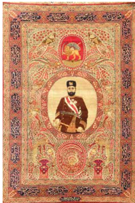
تصویر ۱۳- قالی شجاع نظام، نقش شیر و خورشید خانم، بافت راور، ۱۲۶۲ ه. ش، ۲۲۴×۱۴۴

جایگاه این نگاره در قالی‌های مرسوم و دارای نقش مایه‌های گیاهی عموماً در میان قالی و در نقاطی همانند ترنج، لچک و یا متن و نه در حاشیه به شکلی شکسته و یا منحنی مشاهده می‌شود. از این رو تداعی مفاهیم ویژه‌ای را بنا بر نوع جایگاه به همراه دارد. حضور نگاره مورد بحث در ترنج قالی با تشدید و تأکید بر آن، در لچک حضور خالق و یا نیرویی ماورایی و قدسی در پس حجاب و در متن قالی بنا بر نوع طرح، با مفاهیم متنوعی همراه است. همچنین