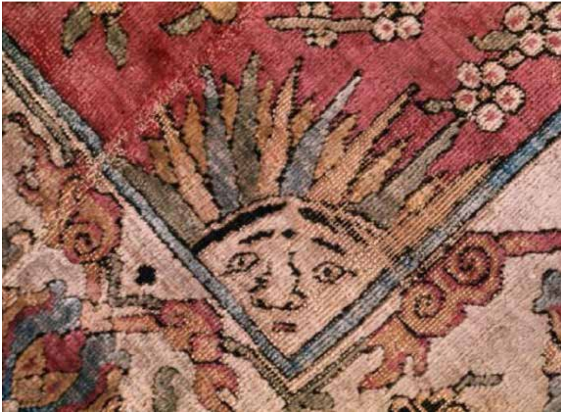
تصویر ۴- نقش مایه خورشید خانم در لچک فرش، بافت تبریز، (Sakhai, 2008, 154)

نصب گردد و همواره تجلی و یادآور ذات حق تعالی در نظر بیننده با دفعات مشاهده این قالی باشد.