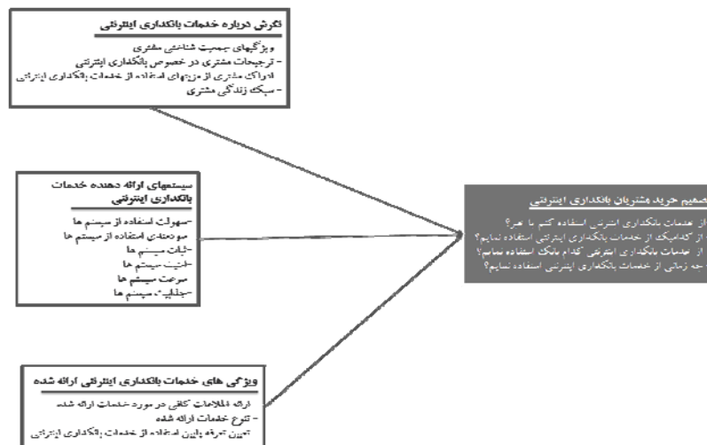
نمودار ۱. عوامل مؤثر بر تصمیم خرید مشتریان بانکداری اینترنتی

براساس بررسی‌های به‌عمل آمده در خصوص موضوع تحقیق، تمامی متغیرهای در نظر گرفته شده در مدل این تحقیق، در طیف وسیعی از پژوهش‌های انجام شده در این حوزه مورد استفاده قرار گرفته‌اند و فرضیه‌های تحقیق بر اساس طیف وسیعی از تحقیقات مورد حمایت قرار دارند. همچنین روایی ظاهری مدل با توجه به نظرات خبرگان بانکی و در نظر گرفتن شرایط ایران مورد بررسی و تأیید قرار گرفت. روایی ظاهری هنگامی برقرار است که فردی متخصص یا آزموده آن را بررسی نماید و نتیجه بگیرد که مدل از روایی لازم برخوردار است. متغیرهای مؤثر بر تصمیم خرید مشتریان بانکداری اینترنتی مورد بررسی در این پژوهش، در نمودار (۱) به تصویر کشیده شده است.