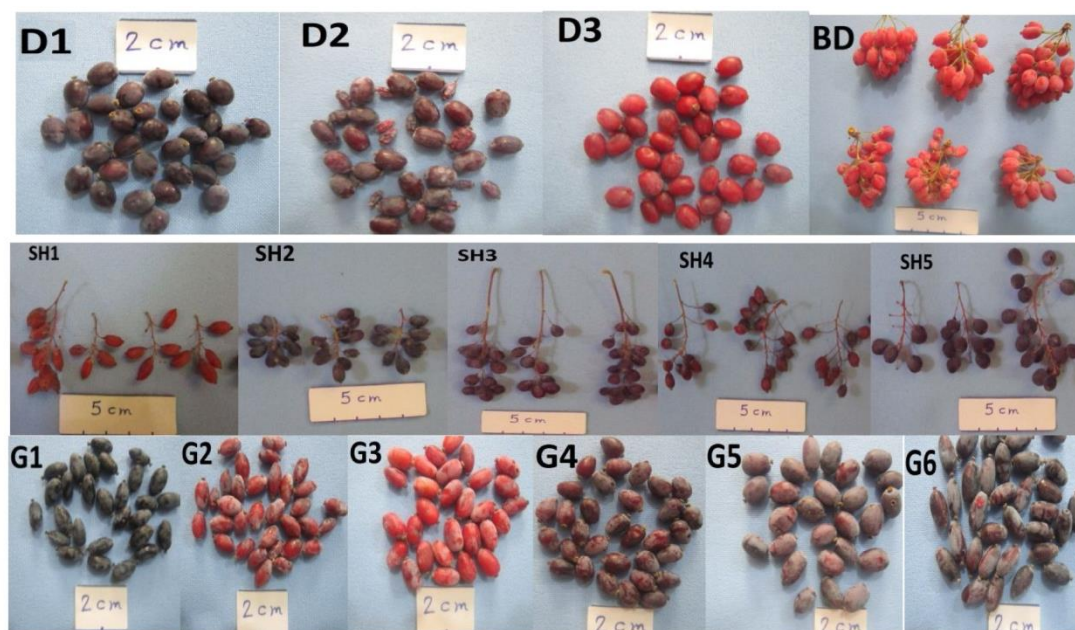
شکل ۱- میوه ژنوتیپ‌های مختلف جمع‌آوری شده زرشک.