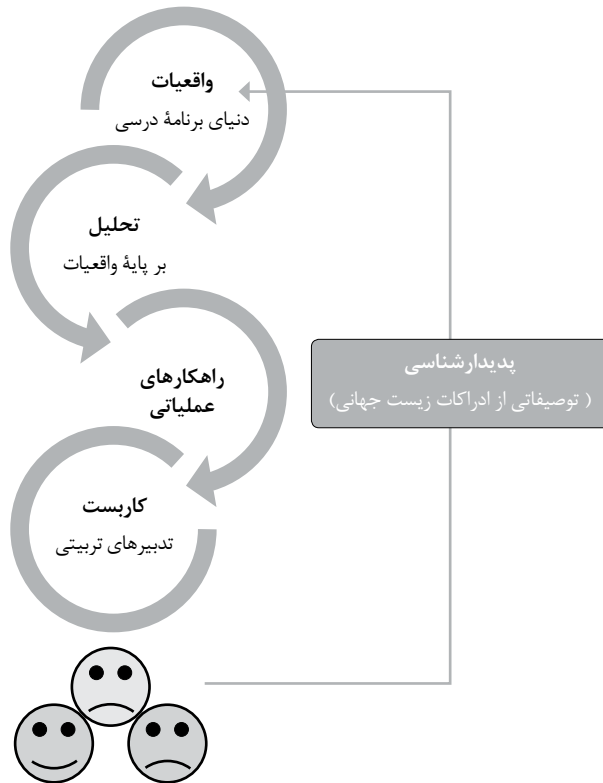
شکل ۳ کاربرد نتایج پدیدارشناسی در حوزه برنامه درسی

و عملکردهای این حوزه پیچیده، استفاده نمود. شکل ۲ مسیری را برای استفاده از پژوهش‌های پدیدارشناختی در واقعیات برنامه درسی پیشنهاد می‌دهد.