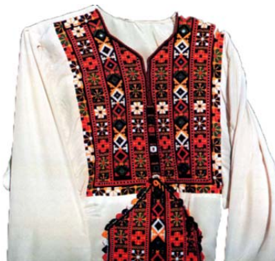
شکل ۳. رنگ بندی‌های فام گرم در سوزن‌دوزی سنتی بلوچ

رنگ: رنگ‌های گرم از طیف نارنجی و قرمز شنگرف به‌صورت فراوانی در سوزن‌دوزی‌های سنتی بلوچ به‌کار می‌رفته است. این رنگ‌ها در سوزن‌دوزی‌های معاصر دستخوش تغییراتی شده اما، ملاک در ارزیابی زیبایی‌شناسانه آن‌ها نمونه‌های اصیل و سنتی است. البته این رنگ‌ها در کنار استفاده اندک از رنگ‌های سرد و به‌خصوص سیاه و سبز است که معنی می‌یابند. (شکل ۳)