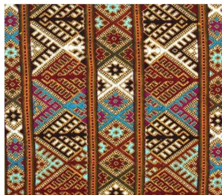
شکل ۲. خطوط راست و شکسته در سوزن‌دوزی بلوچ

میزان انتزاع یا برخورد رئال: مردمان بلوچ با هنرهای تصویری خود کاملاً انتزاعی و تجریدی اما متأثر از طبیعت منطقه خود برخورد می‌کنند. نمی‌توان به انتزاع مدرن در این رویکرد ارجاع نمود. انتزاع سوزن‌دوزی بلوچ حاصل گذشت تاریخ بر این فرهنگ است. (شکل ۴)