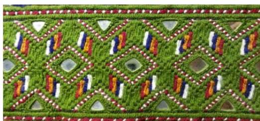
شکل ۴. نمونه نقوش تجریدی سوزن‌دوزی به بلوچ همراه آینه‌کاری

http://1000dokan.com/%D8%B3%D9%88%D8%B2%D9%86-